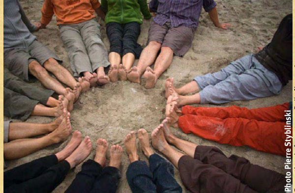
Formation de formateurs Belle-Île 2008